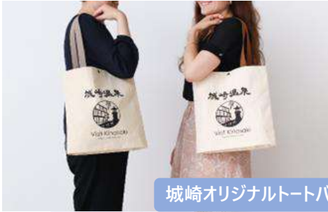
城崎オリジナルトートバッグ

上述の動画は、コロナ後の旅行先として訪れたいと思っただけ るよう、城崎の楽しみ方を各国に合わせて紹介する内容になってい ます。動画はYouTubeにてご覧いただけます。