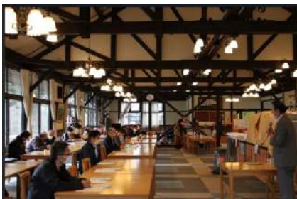
ワークショップで 感染症ハンドブックを配布