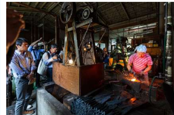
参加工場でのイベント

2020年には、KOUBAの日常に触れることができる、60を超える動画コンテンツを整備した上で、1か月にわたりオンラインイベントを開催し、さらなるファンを獲得。