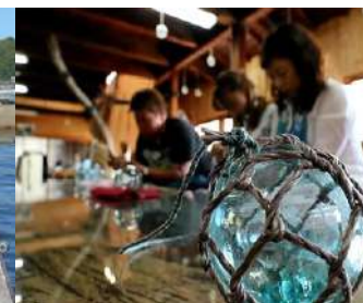
地元の産業を活用した体験コンテンツ