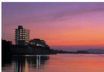
油谷湾温泉ホテル楊貴館 (山口県油谷湾温泉)