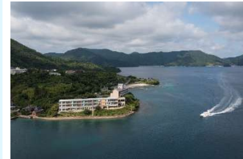
海から見た海士町

担い手不足の解消に向けて「特定地域づくり事業協同組合」を全国に先駆けて設立。また、島の未来を共に創る若者の新たな挑戦を支援するための財源として、ふるさと納税を原資とした「海士町未来共創基金」を設置。