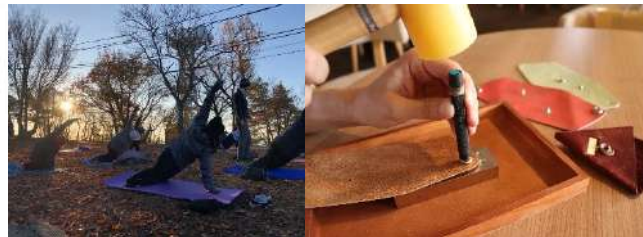
国内観光向け体験コンテンツ (ピラティスやレザークラフト等)