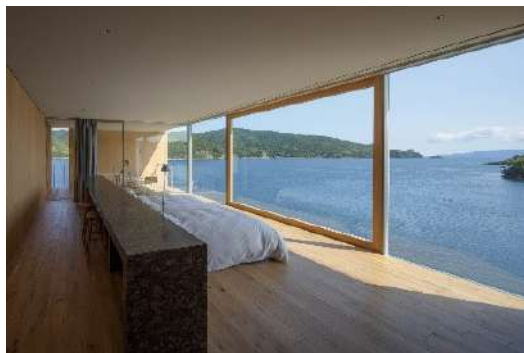
リニューアル開業した島唯一のホテル「Ento」