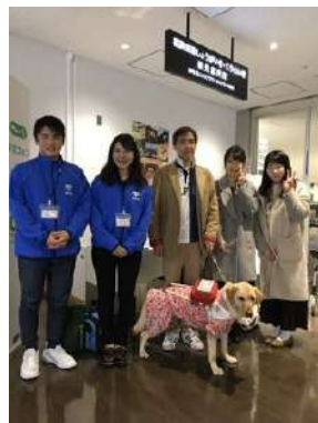
福岡空港しょうがい者・こわい者観光案内所