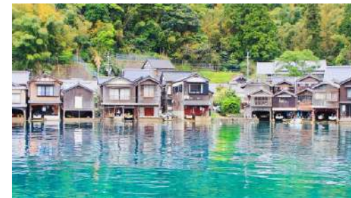
湾に沿って立ち並ぶ「舟屋」