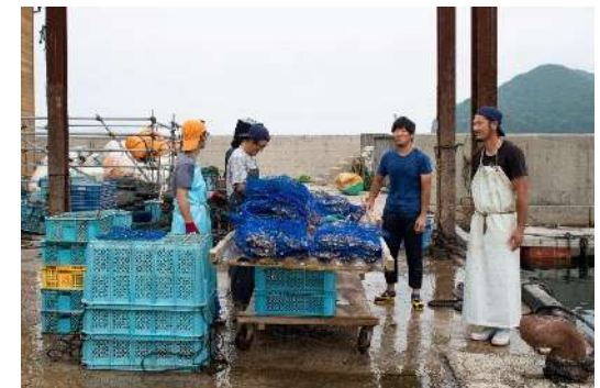
地域産業（岩牡蠣）の体験