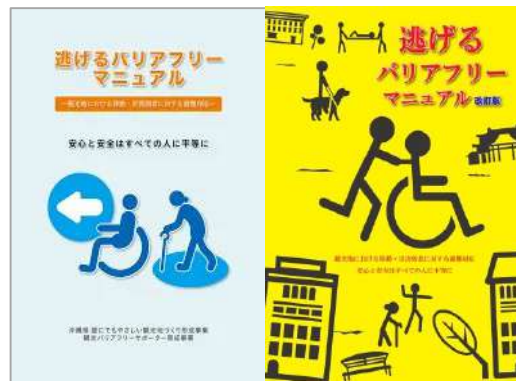
逃げるバリアフリーマニュアル