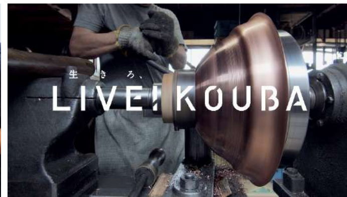
オンラインイベントの配信映像