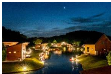
グランエレメント (滋賀県米原市)

ゴルフ場を改修した、開放感溢れるグランピング施設を展開し、新たな可能性が評価された。