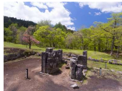
世界遺産「橋野鉄鉱山」