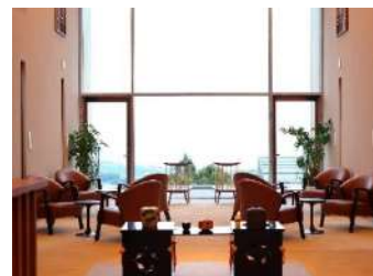
テラス御堂原 (大分県別府温泉)

ゴルフ場を改修した、開放感溢れるグランピング施設を展開し、新たな可能性が評価された。