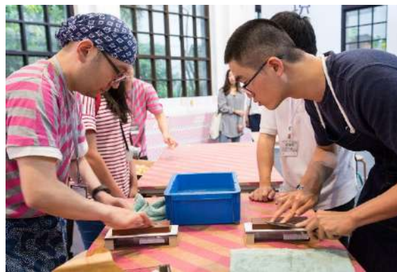
海外でのイベント体験風景