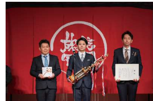
第5回 旅館甲子園表彰式