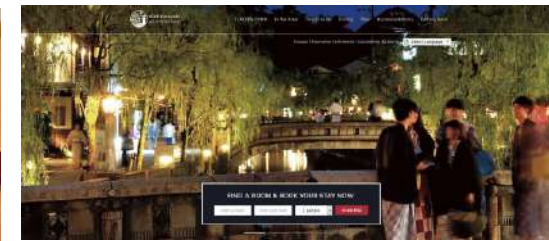
外国人向け予約サイト 「Visit Kinosaki」