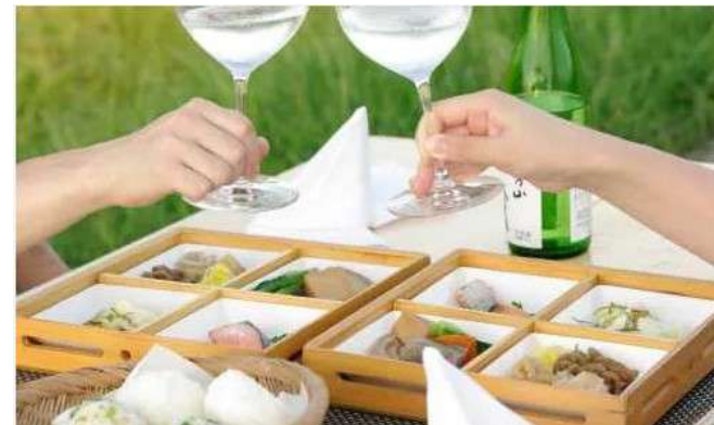
あぜ道でランチをする 「田んぼランチ」