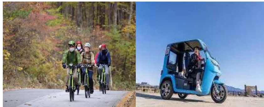
地域と連携し新たなガイドツアーを造成