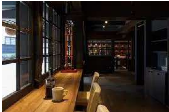
2020年に「ryugon」内に カフェをオープン