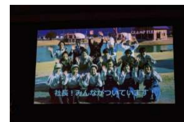
地元と直結したオンラインの様子