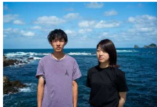
「離島ワーホリ」参加者