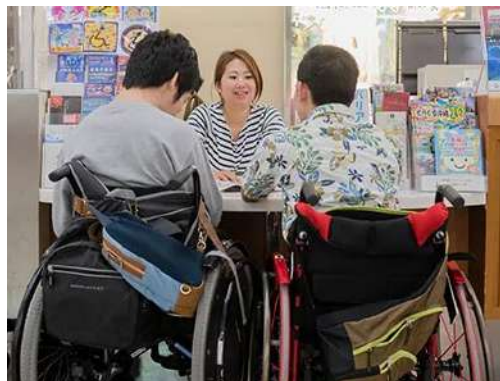
那覇空港しょうがい者・こわい者観光案内所