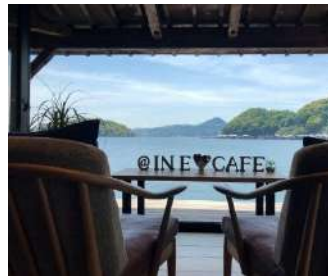
宿泊施設の夕食の役割を担う 公設民営の飲食店