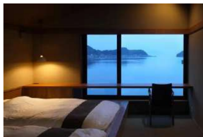
舟屋をリノベーションした 一棟貸しの宿泊施設